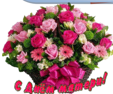
Ельников Дима (7 класс)

Мама - это первое слово ребенка, это - первый человек, которого видит ребенок. Поэтому почти весь мир выбирает маму. Она тебя не бросит в трудный момент.