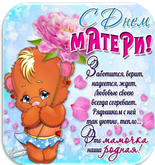
Петриченко Данил (7 класс)

Я считаю, что мама и бабушка – это самые важные члены семьи, они нам помогают, заботятся о нас, они делают так, чтобы жизнь была лучше и веселее.