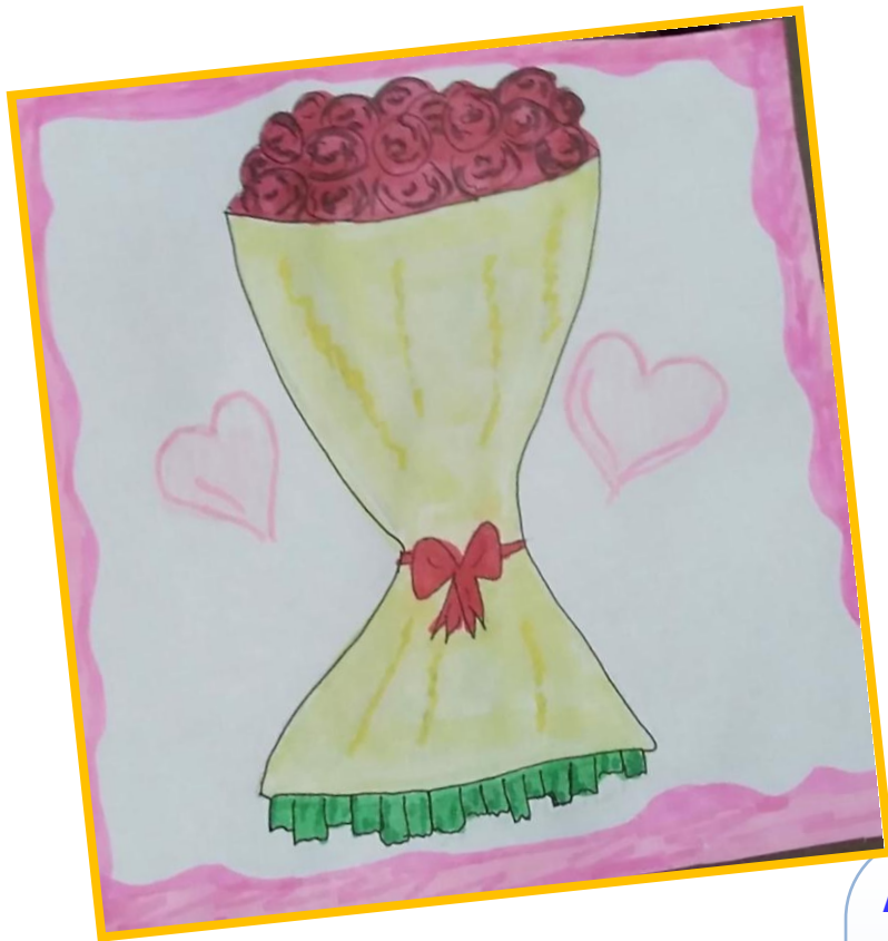
«Букет для мамы»

И сегодня мы от всей души говорим Вам слова благодарности, признания в искренней любви к Вам!